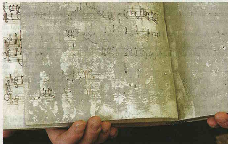
Das Notenblatt: Das Schlamwasser hat wertvolle Musikstücke beschädigt.

Kunst, ab dem 14. Jahrhundert, lag 72 Stunden im fast zwei Meter hohen Schlammbad. «Das zu sehen, tat im Herzen unendlich weh», sagt Schwester Rut-Maria: Ölbilder hatten sich in Einzelteile aufgelöst, Bücher waren aufgequollen, Musiknoten kaum mehr als solche erkennbar, Textilien und Stickereien verdreckt.