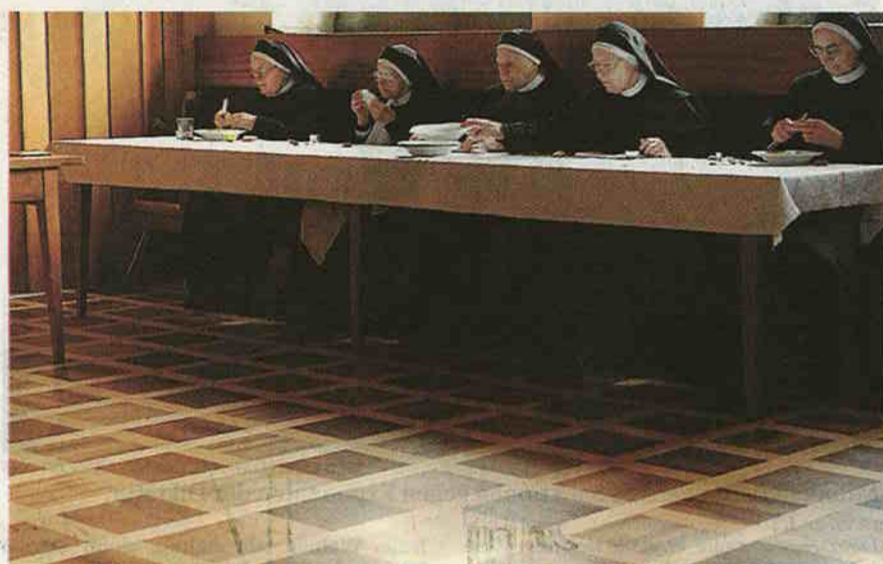
Das Mittagessen: Die Nonnen essen still und hören der Vorleserin zu.